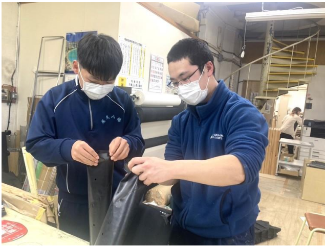
3、丸型ジャバラの製作体験 円筒型ジャバラチームにて丸型ジャバラを製作、指導している写真です。