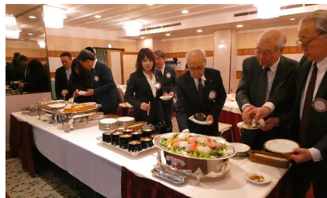
ビュッフェでのお食事。人気のカレーは早くに無くなりました。