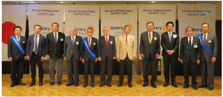
合同例会融合写真